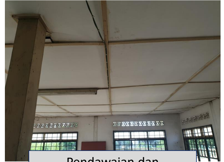
Pendawaian dan kelengkapan elektrik lama