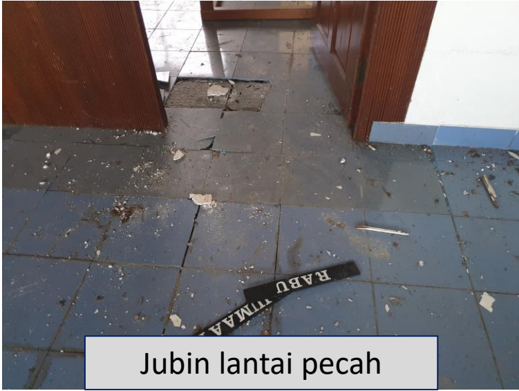
Jubin lantai pecah