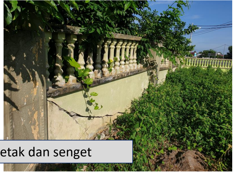
Tembok pagar retak dan senget